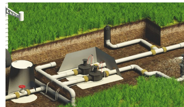
Энергиятежамкор ирригация насоси